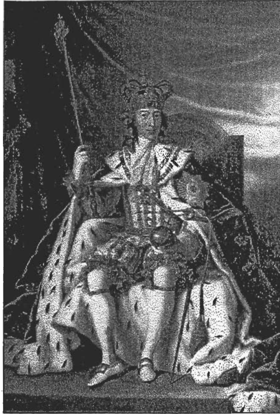
En konge på sin trone med kronen, scepteret og rigsæblet