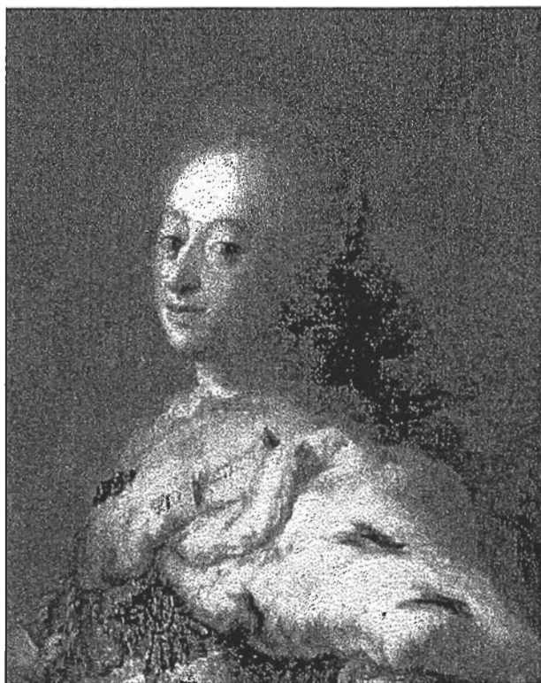
Frederik den 5., født 1723, konge 1746, død 1766